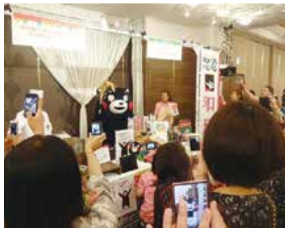
熊本県営業部長「くまもん」が大人気