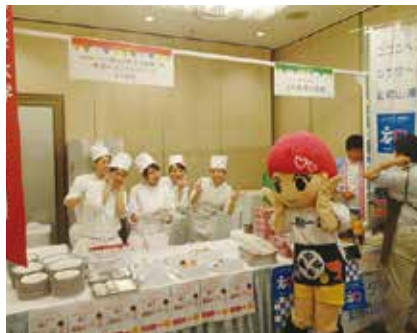
梅花女子大学の和歌山のいちじくスイーツ