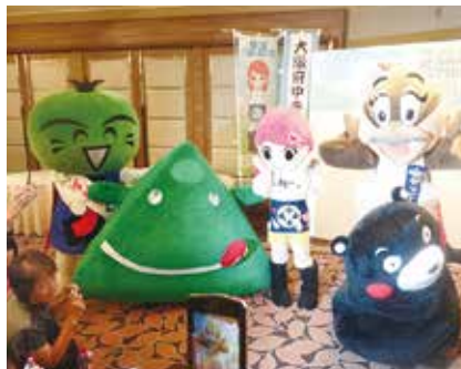
オープニングで出迎える「せりちゃん」たち