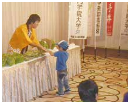
追手門学院大学の模擬せり