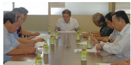
市場開放デーイベント案内(9月11日案)

漁旗設営。⑤当日（11月15日）…誘導責任者の会場内誘導（7時30分から12時30分）○チラシ案＝大阪府広報担当副知事もずやんがオープニングに出席いただけることになったので、チラシへの反映など。