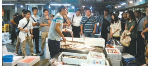
水産卸店舗を見学する先生一行

8月19日、台湾高雄市農協の27名の一行に、青果のせりや青果水産卸売場などに加えて、バナナ加工施設や青果卸事業者の保冷庫などを案内したほか、8月27日、大阪府泉南市教育研究会 社会部の先33名の先生方からは、3月から稼動している国内最大の燃料電池施設などを案内。また、9月3日には、大阪大学医学部の学生14名が先生とともに来場され、市場とともに食品衛生検査所を見学されるなど、府と協力して、来場者の多様なニーズに