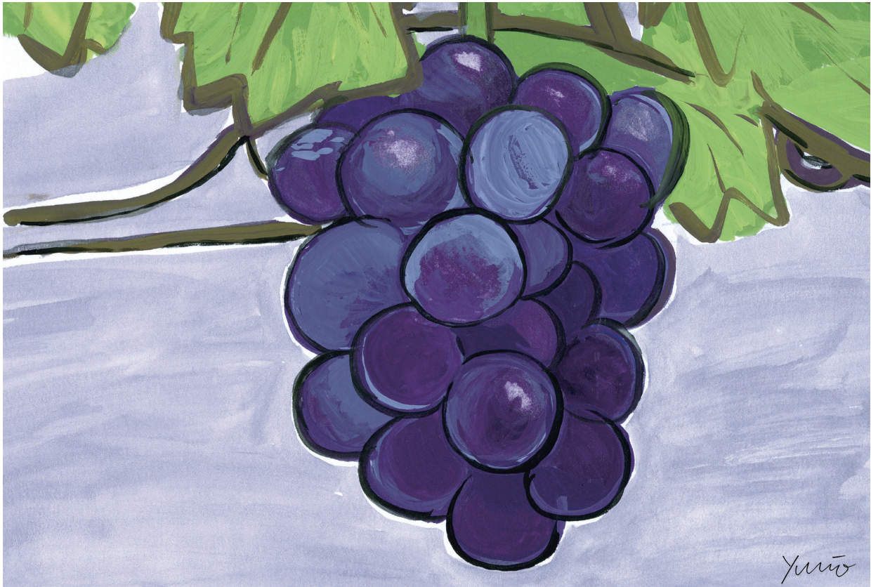
絵：「ぶどう」磯野 由美（磯丸運送）

大阪府中央卸売市場協会 茨木市宮島1-1-1 TEL (072) 636-3698 FAX (072) 636-3699 MAIL: 36983699@ iaa.itkeeper.ne.jp