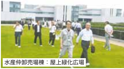
水産卸売場棟：屋上緑化広場