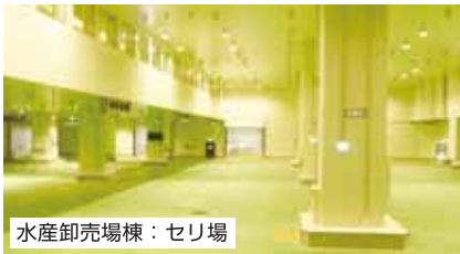
水産卸売場棟：セリ場