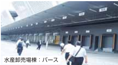
水産卸売場棟：バス