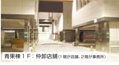
青果棟1F：仲卸店舗(1階が店舗、2階が事務所)

修繕工事幅2.3M(2.5M(工期)10月中)事業費287万円※青果エリアは立駐C改修整備後着手 ■こみ問題 □不法投棄の防止 ◆不法投棄件数(8月、18件) 対策開始前比に比べ87%減少、諸対策を継続実施 □青果未排出状況(8月対前年比) 1.1トン(万戸未満四捨五入) ◆8月単月実績 □排出量約10.2トン ◆19% ○処理費用199.7万円 ◆19% ○8月までの累計 □排出量4.68トン ◆29% ○処理費用91.0万円(▲29%) ■電気料金の改定(8月請求分) ○関電Ⅱネット(概ね34.6%減) ■茨木消防署査察開場以来初めて ◆これまでの査察結果 ○査察日(7月9日、4日間) ○査察済み施設 水産卸売棟、水産卸売棟など ※消火栓周りの物件放置など詳細な項目 ◆今後査察予定施設 ○青果卸売棟、仲卸売棟、冷蔵庫棟、一般加工棟等すべての防火対象物 ■当面の重点事業と課題 ◆分煙コーナーの整備と禁煙の徹底(違反者に対する入場禁止の行政処分) ◆荷捌きスペースの確保 ◆産地要請による円滑な物流の確保と線引(2.0メートル)の秩序維持 ◆物品の整理と線引(2.0メートル)の中央線、ウイング車停車位置等 ◆府依頼事業(府財源)の推進 ○青果立体駐車場C改修工事平成30年1月9日着工、3月31日竣工予定 ○青果組合の全面的な協力がない可欠※年度内竣工が絶対条件、不能であれば今後予算措置が困難 ○管理棟窓面台修繕工事 ○管理棟屋上防水修繕工事 ◆コールドチェーン化の実現(売場定温管理)調査業務基本構想(ラフ案)に着手