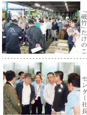
○近郊売場の「破竹」たけのこ