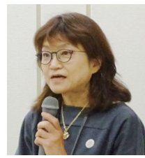
湯城衛検所長 庫や冷凍 庫で保存、 50℃以上 で保存、③ 水分活性 / 相対湿

②酸素がなければ生きられない、② 温度 ①発生しやすい温度は20～30 ℃。冷蔵庫(4℃)でもゆっくり生え る。③水分活性 ①相対湿度。好乾性 カビでも水がなければ生えられな い。④栄養分(ゴミや埃(有機物))を あげられた。では、カビが生えないよ うにするには、上記のいずれかの条 件をカットすればよいので「①酸素 ↓脱酸素剤・真空パックの利用、②温 度↓冷蔵 庫や冷凍 庫で保存、 50℃以上 で保存、③ 水分活性 / 相対湿